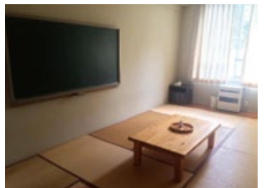
小学校の廃校を改装した簡易宿泊施設です。元教室が宿泊場所になっています。